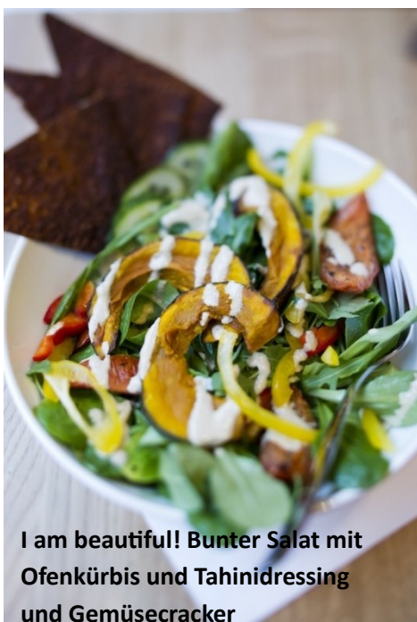
I am beautiful! Bunter Salat mit Ofenkürbis und Tahinidressing und Gemüsecracker