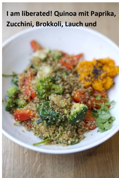
I am liberated! Quinoa mit Paprika, Zucchini, Brokkoli, Lauch und